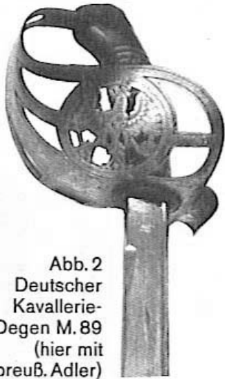
Abb. 2 Deutscher Kavallerie- Degen M. 89 (hier mit preuß. Adler)

Veröffentlicht im Deutschen Waffen-Journal, Heft 11/1967