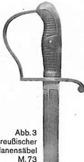
Abb. 3 Preußischer Ulanensäbel M. 73