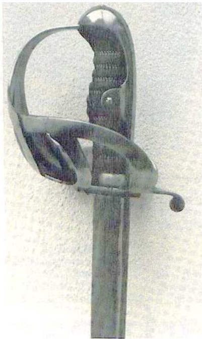
Abb. 3 Außenseite des Gefäßes. Stempelungen: 1920 und A./R. R. 17. 10.

Veröffentlicht im Deutschen Waffen-Journal, Heft 10/1983